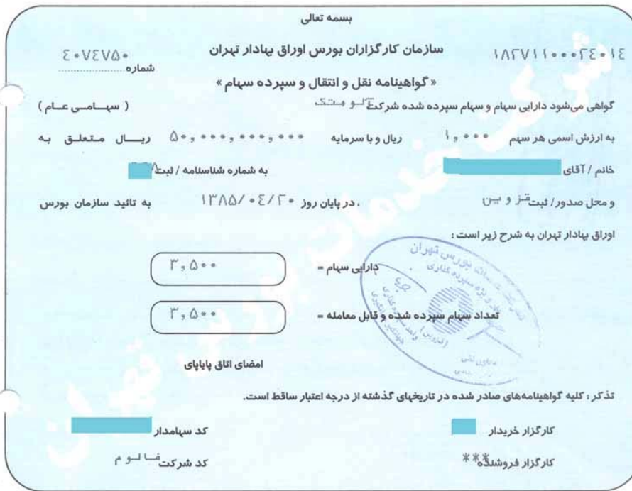
نمونه گواهینامه نقل و انتقال سهام - تالار اصلی