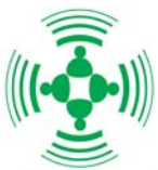
نمونه اعلامیه فروش